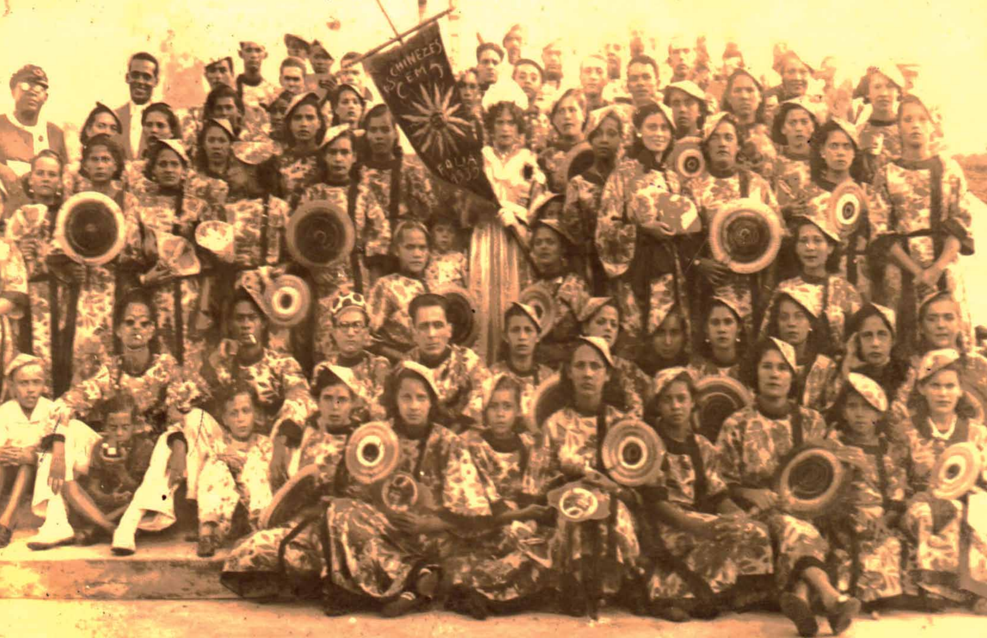
OS CHINEZES EM COLIA 1939