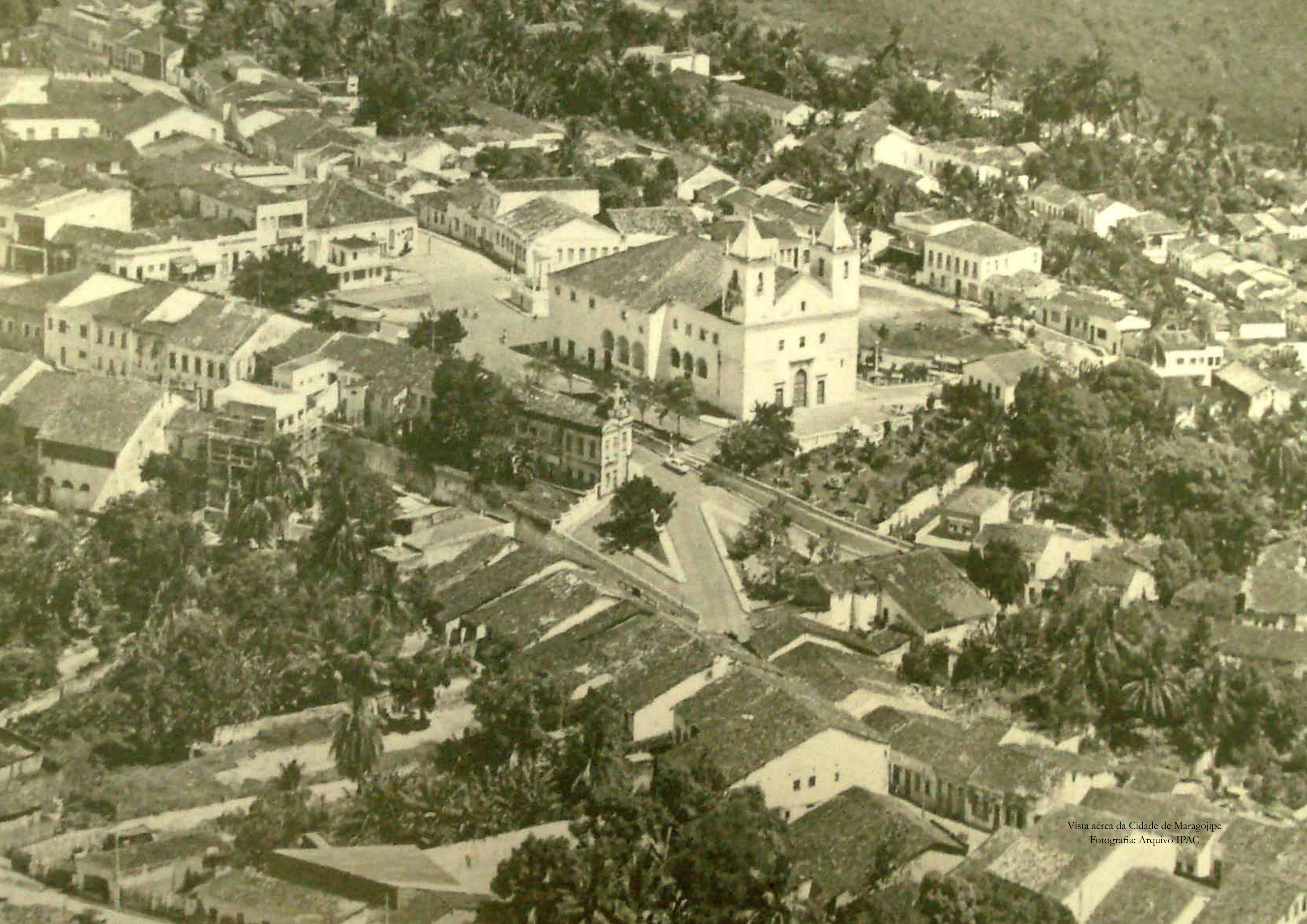
Vista aérea da Cidade de Maragogipe