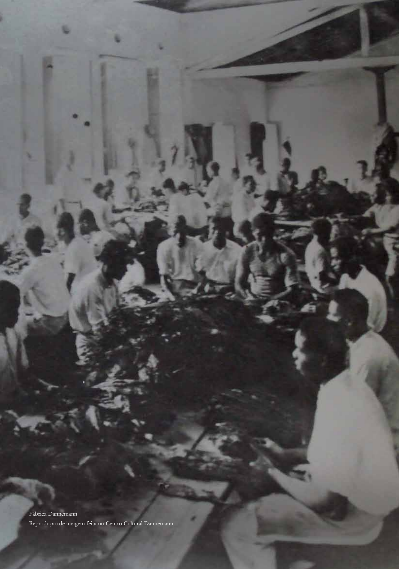
Fábrica Dannemann Reprodução de imagem feita no Centro Cultural Dannemann