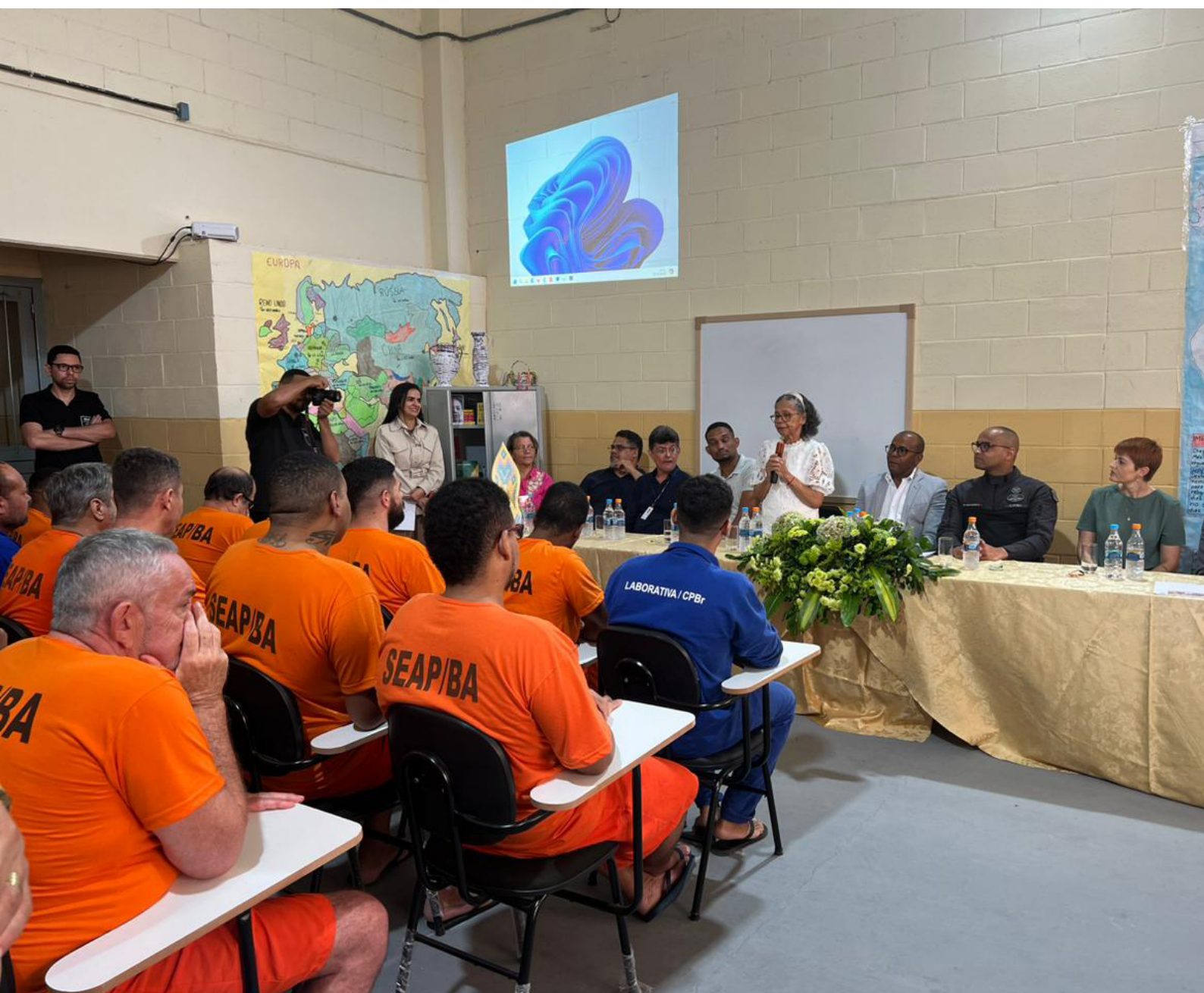
Aula Inaugural na unidade prisional de Brumado - Escola Municipal Antônio Carlos Magalhães.

É neste contexto que buscou-se contemplar as particularidades do cotidiano vivido nas unidades prisionais a partir da construção de uma oferta educacional para os sujeitos jovens e adultos que se encontram em privação de liberdade, integrando a dinâmica organizacional e curricular da EJA às necessidades de aprendizagem e formas de vida e sobrevivência desse coletivo.