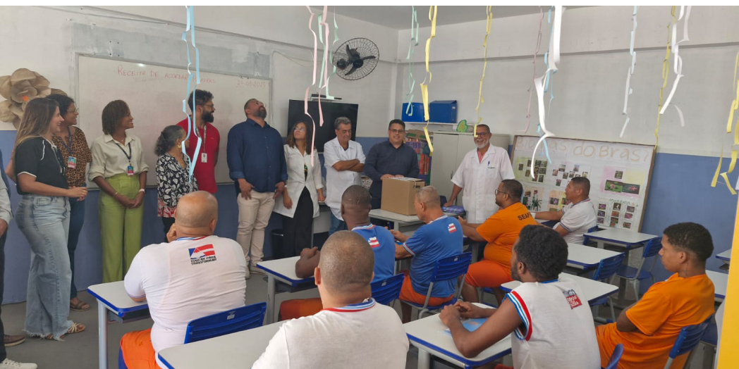
Atividade de remição pela leitura na Colônia Penal de Simões Filho anexo do Colégio Estadual Dr. Berlindo Mamede de Oliveira

O direito à remição da pena pela leitura é a que mais tem se aproximado da educação formal e, pela sua natureza, pode ser articulada efetivamente ao desenvolvimento da oferta de EJA nas unidades prisionais. A experiência relatada a seguir é um exemplo de articulação entre educação formal e não formal não só no pensar, mas no fazer. Todo trabalho é desenvolvido pela equipe da Unidade Escolar de Vinculação.