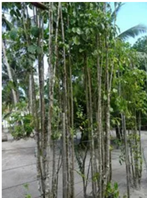
Pé de beriba

Trata-se de uma madeira mais leve, indicada para quem está iniciando seu aprendizado, pois o berimbau fica mais leve. Mas é menos resistente do que outras madeiras.