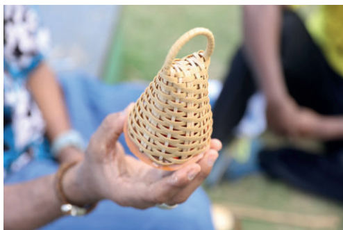
Foto: Berimbau - Salvaguarda da Capoeira

Na capoeira, esse instrumento é utilizado junto ao berimbau. Chama-se de berimbau completo o instrumento que inclui o caxixi.