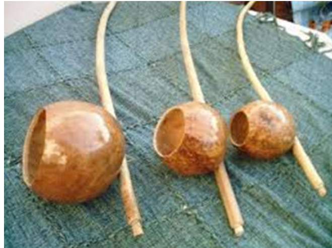
Madeiras para o prepare do berimbau

Outras madeiras: pereira, guatambu, ipê, freixo e pau d´arco, dentre outras.