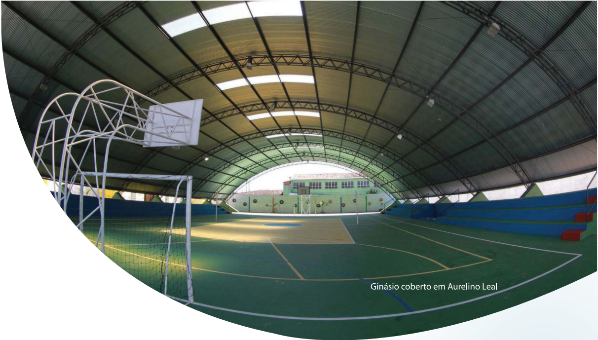
Ginásio coberto em Aurelino Leal