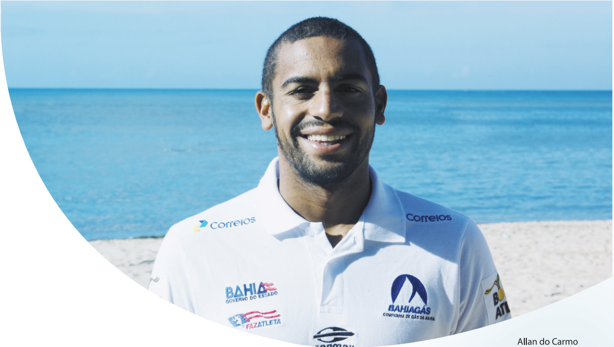
Allan do Carmo campeão mundial de maratonas aquáticas