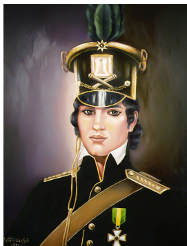
Cadete Maria Quitéria