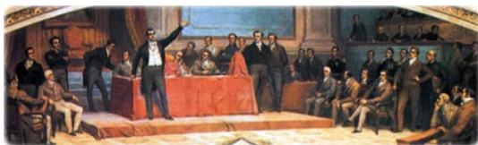
Manoel Fernandes Thomaz, presidente das Cortes Constituintes, discursa em uma das sessões. Pintura de Veloso Salgado, na Assembleia da República de Portugal.

pois julgava-se que esses militares estavam trabalhando como intermediários do governo lisboeta. Esse desagredo provocou embates violentos no Pará; Bahia e, em Pernambuco.