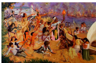
“Alegoria ao 7 de Janeiro de 1823”

Autor: Mike Sam Chagas/OST 2019- Escola de Belas Artes da UFBA