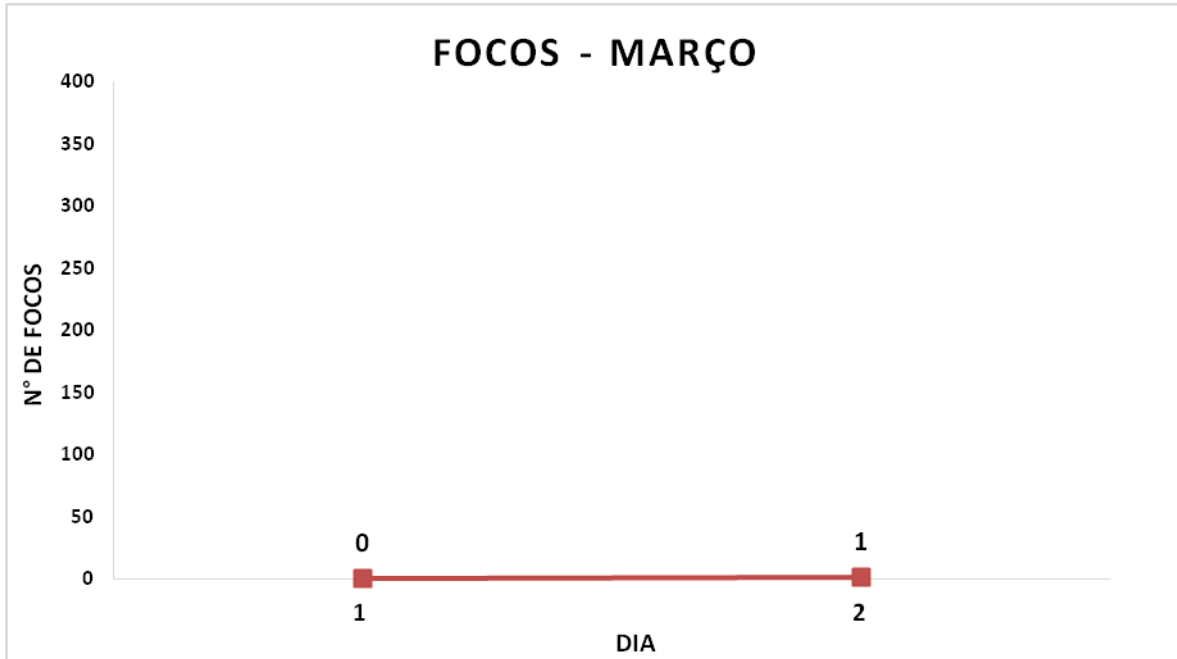
Gráfico – Número diário de Focos de Calor na Bahia através de Satélite de Referência.

O Gráfico indica o número total de focos de calor registrado no período de 01/03/2026 a 02/03/2026 , em todo o estado da Bahia, considerando os dados do Satélite de Referência (AQUA M-T) .