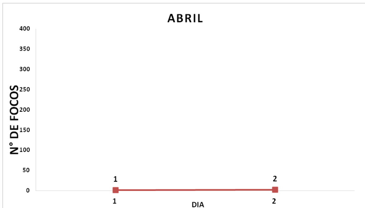
Gráfico – Número diário de Focos de Calor na Bahia através de Satélite de Referência.

O Gráfico indica o número total de focos de calor registrado no período de 01/04/20256 a 02/04/2026 , em todo o estado da Bahia, considerando os dados do Satélite de Referência (AQUA M-T) .