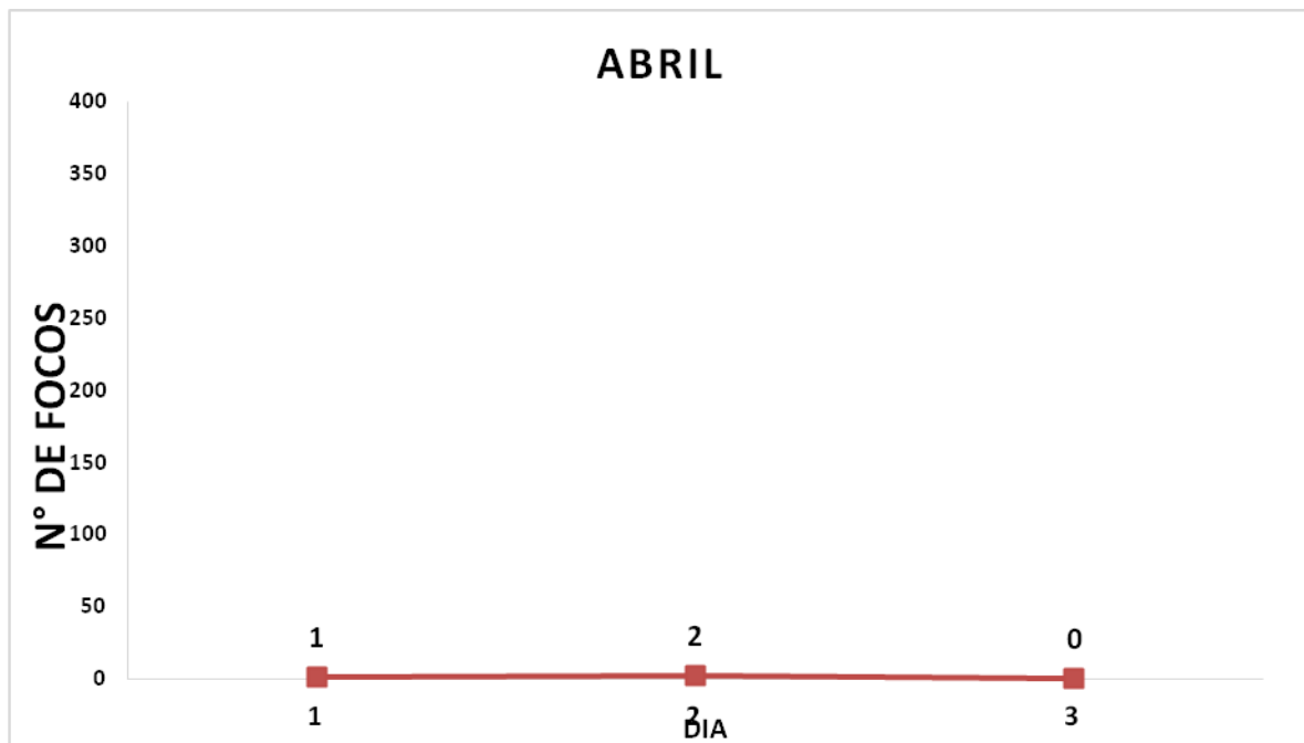
Gráfico – Número diário de Focos de Calor na Bahia através de Satélite de Referência.

O Gráfico indica o número total de focos de calor registrado no período de 01/04/20256 a 03/04/2026 , em todo o estado da Bahia, considerando os dados do Satélite de Referência (AQUA M-T) .