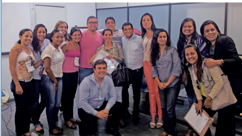
Os novos Triadores em treinamento na sede da Junta

Responsáveis pela recepção, protocolo e triagem dos processos do registro público de empresas mercantis e atividades afins no interior do Estado da Bahia, os novos triadores que atuam nos Escritórios Regionais da Junta Comercial participaram do treinamento realizado na sede da autarquia, em Salvador, entre os dias 12 e 30 de maio de 2014, com vista a tornar os profissionais oficialmente habilitados tanto para executarem suas tarefas, quanto para terem acesso aos sistemas necessários ao exercício de suas funções.