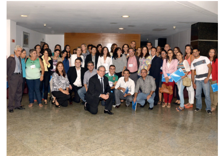
Grande envolvimento de servidores

A Junta Comercial da Bahia está constantemente implementando ferramentas de gestão que possibilitem mais transparência à gestão e motivem a equipe a trabalhar no sentido de alçá-la ao nível das Juntas de maior destaque no Brasil. Com isso, a autarquia promoveu a sua Reunião de Metas, reunindo gestores e funcionários da sede, dos postos SAC da capital e dos 34 escritórios do interior.