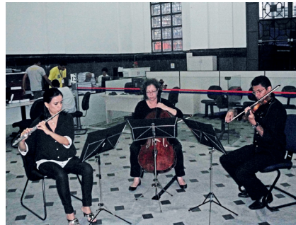
Camerata da OSBA em apresentação na Juceb

Formado em 2001, o Quadro Solar faz parte de uma iniciativa da Secretaria de Cultura da Bahia, através da Fundação Cultural e Teatro Castro Alves, com o objetivo de aproximar o grande público da música erudita, promovendo a formação de plateia. "Percebemos um envolvimento maravilhoso tanto