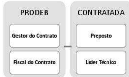
Figura 1 - Representantes da Gestão Contratual

8.2 A execução do contrato deverá ser acompanhada e fiscalizada por representantes da PRODEB, conforme item 22 deste Termo de Referência.