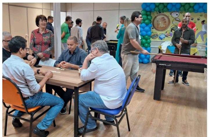
Dia dos pais com a realização de uma tarde de jogos e apresentação do Coral