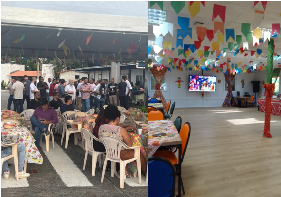
Clima junino invadiu a Prodeb em uma tarde do mês de Junho