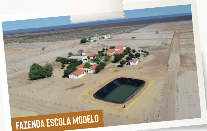
FAZENDA ESCOLA MODELO

O município de Barra abrigará também uma Fazenda Escola Modelo, que está sendo implantada dentro do Centro Estadual de Educação Profissional (CEEP) Águas. O projeto, com área de 146 hectares, vai desenvolver técnicas agropecuárias irrigadas, de sequeiro e agroindustriais e servirá como suporte de formação e capacitação profissional e de experiência para o Polo Agroindustrial e Bioenergético.