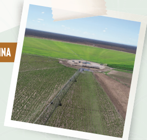
FAZENDA CANTO DA SALINA

Projeto agroindustrial - 1.800 hectares (Barra)