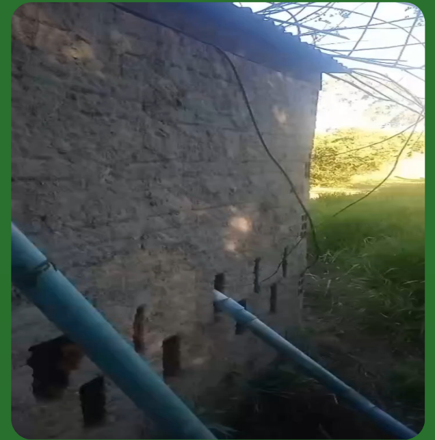
Vídeo do Local