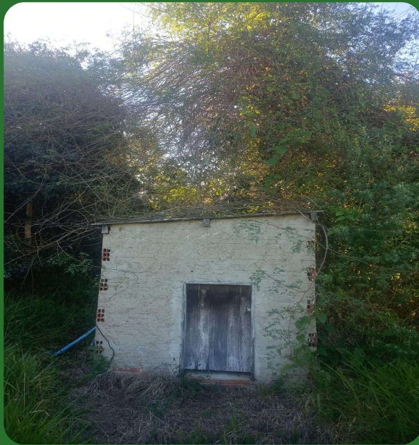
Captação de Água

Conjunto Moto Bomba — Doada pelo Governo do Estado