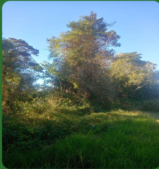
Conjunto Moto Bomba