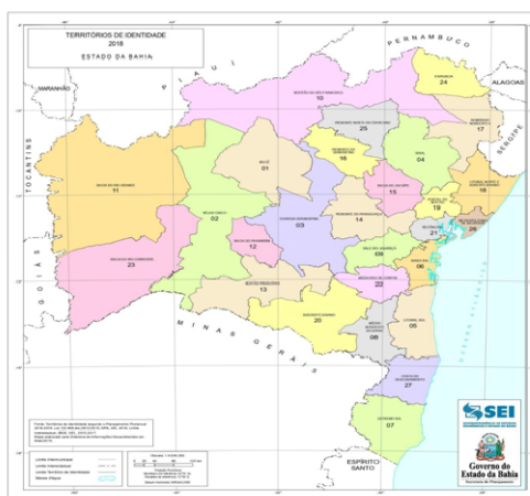
Mapa dos territórios de identidade

O universo de trabalho compreende os 27 Territórios de Identidade (TIs) reconhecidos no Estado, onde estão inseridos 417 municípios. “Os TIs formam a base do planejamento territorial na Bahia e tiveram como o objetivo subsidiar a identificação das prioridades temáticas definidas a partir da realidade local, possibilitando o desenvolvimento equilibrado e sustentável entre as regiões, constituídos a partir da especificidade de cada região. Ver Mapa Territórios de Identidade – 2018 - Estado da Bahia, SEPLAN/SEI (Superintendência de Estudos Econômicos e Sociais da Bahia).