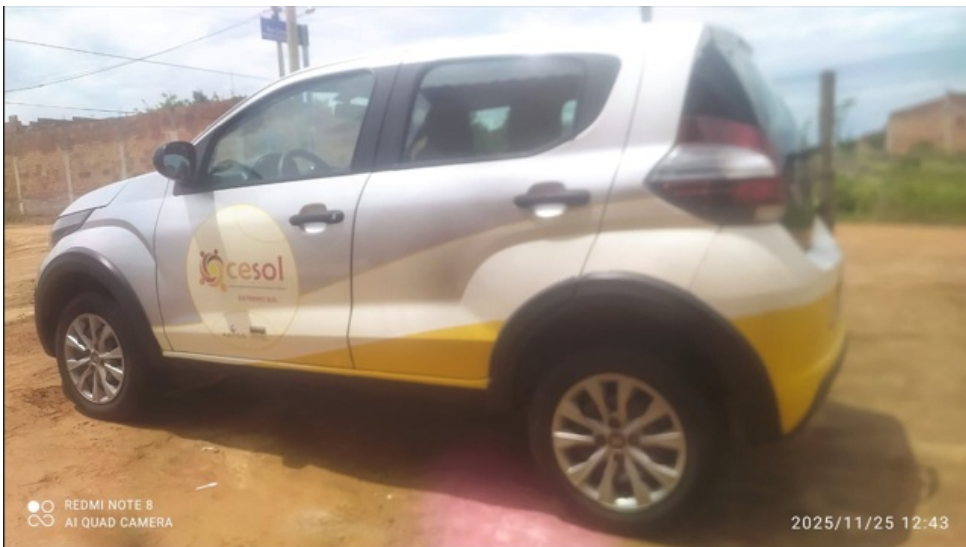
Veículo do Cesol