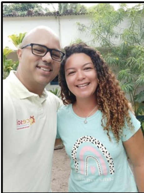
EES Meu Coco é Doce