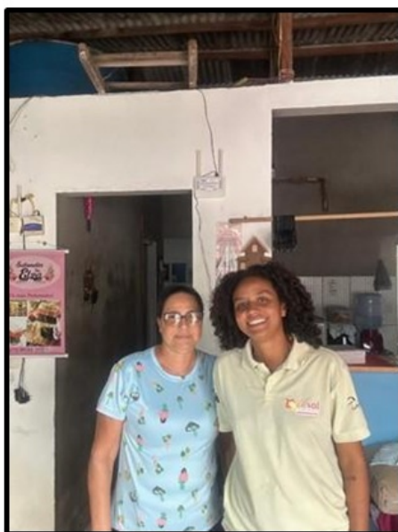
EES Sabonetes da Elza