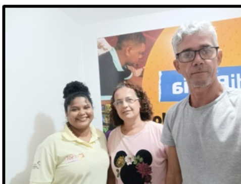
EES Elsete Macramê

Compulsando as informações prestadas e as comprovações, verifica-se o cumprimento do indicador na totalidade.