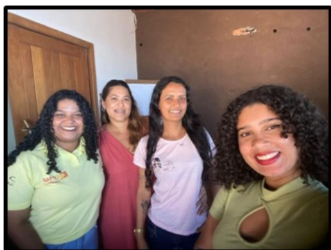
EES Talentos que encantam