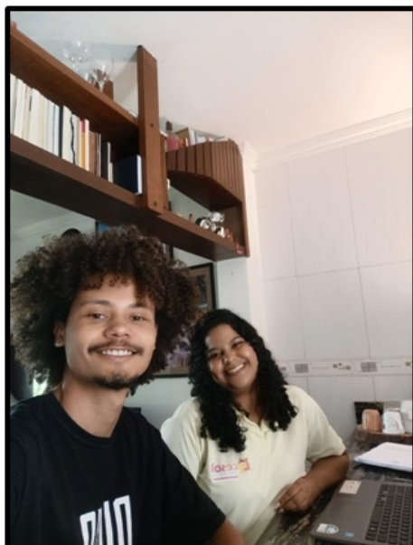
EES Coletivo Ybryda