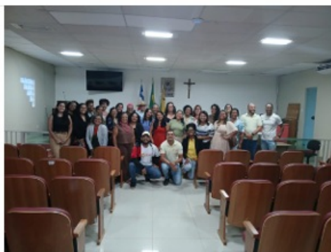
Imagem 85. Realizar assistência técnica em campo específica na cadeia do chocolate

No que se refere à inserção no mercado convencional, foram realizadas orientações sobre a adequação dos produtos às exigências do mercado formal, com atenção especial à rotulagem, validade, padronização, embalagem e precificação justa. Discutiu-se a importância de ampliar os canais de comercialização, incluindo mercados locais, empórios, lojas especializadas e feiras de economia solidária, além da participação em eventos de negócios para prospecção de novos clientes. Também devem ser analisados os custos de produção e a definição de preços compatíveis com o mercado, visando garantir sustentabilidade econômica aos empreendimentos.