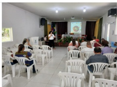
Imagem 86. Realizar assistência técnica em campo específica na cadeia do chocolate