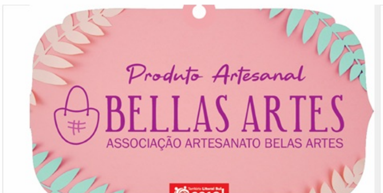
Imagem 19. Melhoria – Elaboração de uma TAG para a Associação Bellas Artes/ Ilhéus.