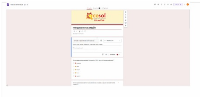
Imagem 88. Modelo de Pesquisa de Satisfação - Google Forms.

Segue a apresentação do modelo de Pesquisa de Satisfação aplicada na durante as atividades de assistência técnica do Centro Público de Economia Solidária Litoral Sul.