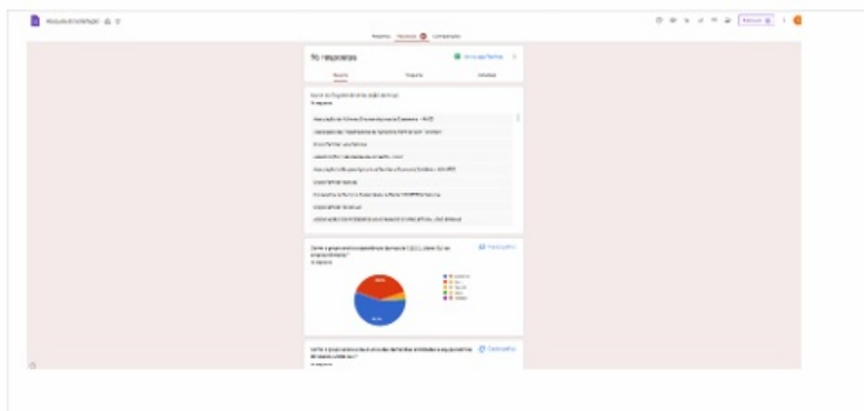
Imagem 89. Modelo de Pesquisa de Satisfação - Google Forms,.