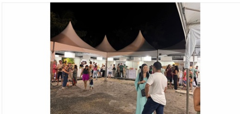
Imagem 26. XI Festival Sabores de Itacaré

Nos dias 17 a 21 de dezembro 2025, a Feira de Economia Solidária Território Litoral Sul, contou com a participação de 20 (vinte) EEs, conectando saberes, culturas e diferentes formas de produzir.