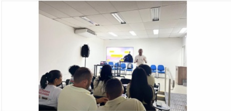
Imagem 69. Qualificação da equipe do CESOL

Os principais resultados alcançados através da qualificação da equipe, estão: elevar o nível técnico, garantir desempenho interpessoais, engajamento e motivação para equipe, alinhamento e organização focado nos resultados e ampliação comercial dos produtos dos EES assistidos pelo CESOL Litoral Sul.