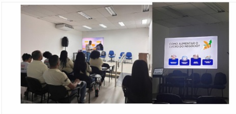
Imagem 70 e 71. Qualificação da equipe do CESOL