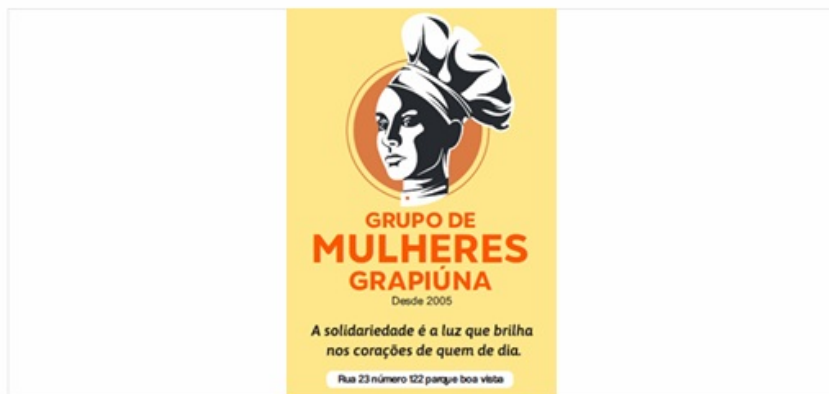
Imagem 17. Melhoria – Elaboração de banner gráfico para a Associação Promocional da Mulher e Amparo da Criança - Mulheres Grapiúna/Itabuna.